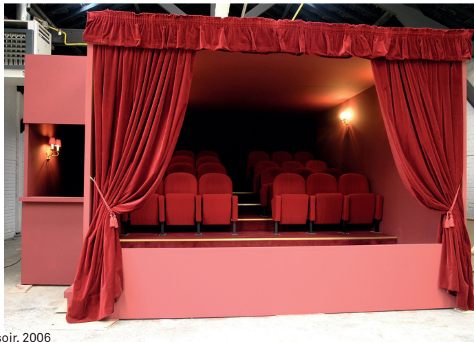
Pierre Ardouvin, Au Théâtre ce soir, 2006 Collection Lafayette Anticipation, Fonds de dotation Famille Moulin, Paris

un programme en trois expositions du 2 février au 19 août 2018