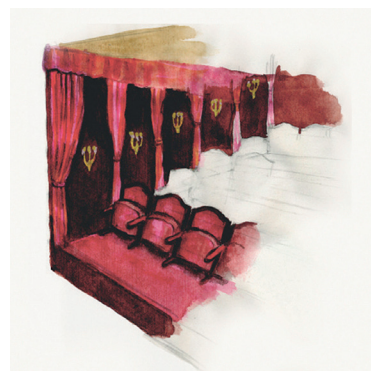
Pierre Ardouin, Au Théâtre ce soir, 2006, dessins préparatoires