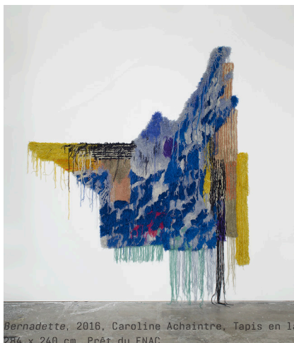
Bernadette, 2016, Caroline Achaintre, Tapis en laine tufté main 254 x 240 cm, Prêt du FNAC