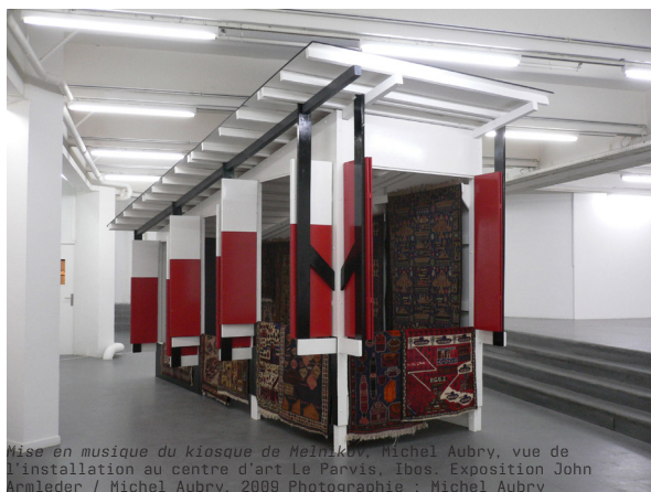
Mise en musique du kiosque de Malinko, Michel Aubry, vue de l'installation au centre d'art Le Parvis, Ibois. Exposition John Armleder / Michel Aubry, 2009

Commissaire : Tiphany Dragaut-Lupescu Scénographie : Dominique Mathieu Signalétique et design : Syndicat